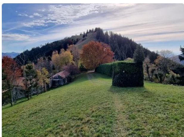
Il col de Rù Splendido

Qui abbandoniamo la strada e imbocchiamo, a sinistra, il sentiero che seguendo il crinale attraversa un amabile pascolo fino a pochi giorni orsono occupato dal bestiame. Dinnanzi a noi il profilo triangolare del monte Mandolino (1106m) con il sentiero che punta dritto alla cima. Ci interroghiamo sull'insolito nome di questo monte e sulla strana abbinata con il monte vicino, Cremona , che richiama la città patria dei liutai. Neppure i locali hanno saputo darmi spiegazione. L'unica ipotesi la trovo in internet dove mondul starebbe per «manzetta» . La salita è ripida, ma breve e divertente, e regala scorci intriganti sul lago e la valle di Adrara. La cima del Mandolino è evitabile percorrendo la traccia sulla sinistra (ce n'è una anche a destra che compie il periplo del monte). La sommità è ricoperta di alberi e la traccia si perde proprio sulla cima.