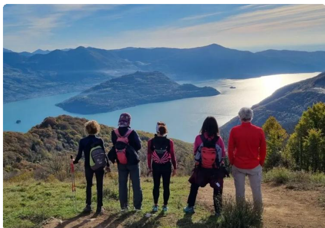
Panorama dal monte CreòAltra

Riprendiamo il cammino e con un ultimo strappo usciamo dal bosco in corrispondenza di una sella pascoliva dove corre la strada che conduce alle antenne installate sulla cima del monte Creò (1106m). Non è un bel biglietto da visita, ma data la vicinanza della cima, decidiamo di raggiungerla ugualmente. Le antenne e la vegetazione limitano parecchio l'orizzonte, tuttavia si riescono ad individuare bene i monti Bronzone, Torrezzo, Guglielmo, la Corna dei Trentapassi e il lago d'Iseo con Montisola , mentre in direzione nord si scorge la Presolana e più lontano ancora l'Adamello .