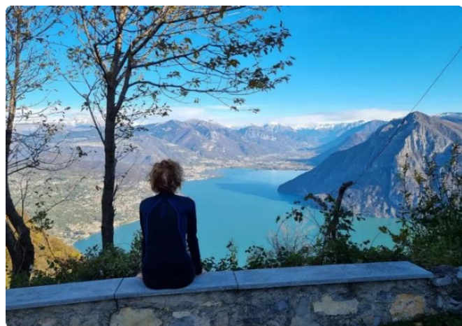
In contemplazione alla Santissima

Entriamo nel recinto della chiesa per ammirarne dall'esterno l'origine romanica, che tuttavia risulta difficile cogliere a causa dei numerosi rifacimenti. Intorno alla chiesa sono visibili resti di murature, indizio di un utilizzo dell'altura con funzioni difensive, suggerito anche dal nome della località: castel dei Pagà (castello dei Pagani). A tale proposito alcuni studiosi citano un documento del 1050 che ricorda come sul mùt dei Pagà si fossero ritirati gli ultimi ariani che contestavano l'invasione da parte delle autorità cattoliche , che con la conquista dell'Italia ad opera di Carlo Magno s'imposero sulle popolazioni locali, trasformando i centri religiosi "pagani" in chiese. Nella parte bassa della chiesa si trovano vestigia di un romitorio di epoca tardomedievale, che costituiscono la parte più antica dell'edificio oggi visibile. Il santuario apre una sola volta l'anno, la domenica successiva la Pentecoste , e al suo interno custodisce alcuni preziosi dipinti del XV secolo . La vegetazione rigogliosa presente sul lato sud della chiesa limita la vista su Montisola e il basso Sebino, tuttavia riusciamo ad intercettare le altre due "Sorelle": la Madonna della Ceriola e Santa Maria della Rota.