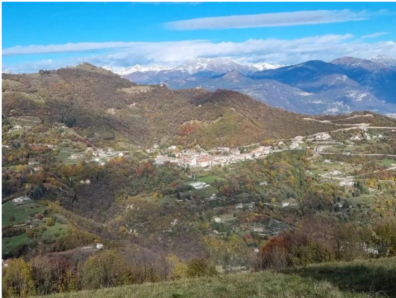
Parzanica e il monte Creò (in lontananza la Presolana)

È piacevole aggirarsi per le anguste vie del borgo che conservano ancora l'atmosfera di un tempo, ben testimoniata dalla torre di pietra del XIV secolo , affacciata sulla via centrale. L'itinerario di oggi si spinge sui colli soprastanti Parzanica con un percorso ad anello che promette panorami interessanti. Prima di iniziare il cammino ci concediamo un caffè presso il bar Alpino, l'unico di Parzanica. Notiamo che è tutto un brulicare di gente, fatto piuttosto insolito per un paesello di montagna. Scopriamo così che oggi si festeggia San Colombano , il santo patrono.