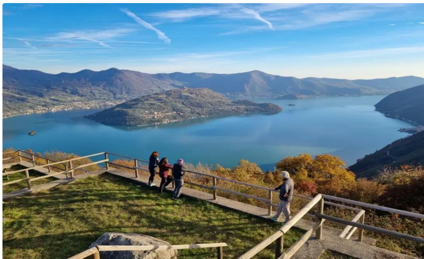
Il Belvedere di Parzanica

Le campane del mezzodì hanno suonato i rintocchi da parecchio tempo e decidiamo di entrare al bar Alpino confidando in un piatto caldo. La cordiale accoglienza, l'ambiente familiare e i gustosi manicaretti della tradizione bergamasca sono stati il degno coronamento di una piacevolissima camminata. Ben rifocillati e sorridenti ci rechiamo a piedi, sopra il paese, in località Belvedere , dove una strada ancora in fase di ultimazione conduce a un terrazzino con vista superlativa sul lago e Montisola . Rimaniamo letteralmente ammutoliti in contemplazione del meraviglioso panorama. Rientriamo in città con il desiderio di tornare quassù ad ammirare le luci del lago in una sera di luna piena.