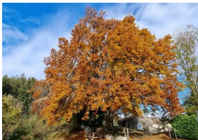
faggio al Col de Rù

Intuitivamente seguiamo l'istinto orientistico che ci porta a percorrere il crinale sud est serpeggiando tra gli abeti fino a sbucare nei prati sopra il col de Rù (1009m). Da un lato si domina la valle di Parzanica, dall'altro quella di Vigolo, sormontata dal monte Bronzone. Qualche clic di rito al cospetto di un coloratissimo faggio e poi ripartiamo ancora seguendo il crinale in direzione del monte Cremona (1078m). La breve ascesa culmina in corrispondenza di una splendida cascina, posta sul cocuzzolo, con un panorama sull'alto lago – un panorama invidiabile perché la dimora è inavvicinabile a causa di una evidente recinzione.